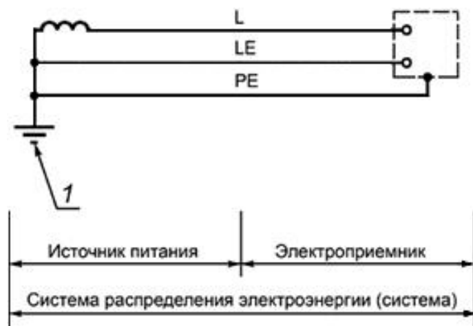
Рисунок 20.2 - Общий вид системы распределения электроэнергии

1 - заземляющее устройство источника питания